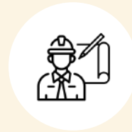
BUREAU D'ÉTUDES & ENCADEMENT

Accessibles à tous les publics, à partir de 15 ans, diplômés et non diplômés, salariés, demandeurs d'emploi, elles sont réalisables sous différents niveaux :