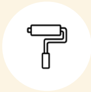
CARRELAGE, PEINTURE & PLÂTRERIE