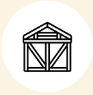
CHARPENTE CONSTRUCTION BOIS