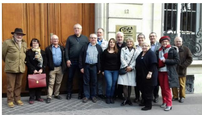
Le Conseil d'Administration de L'Outil en Main devant l'APCMA Paris.

Le siège de L'Union est situé dans les locaux de l'APCMA, 12 avenue Marceau, depuis le 1 er octobre 2016. Le siège de l'Association L'Outil en Main Pays de Loire est accueilli dans les locaux de la CMA à Nantes.